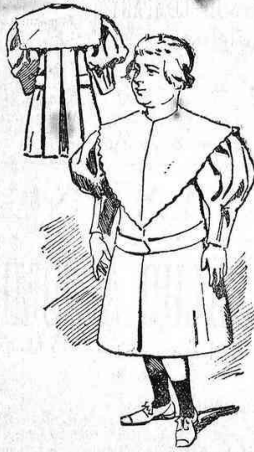
Mangas anchas arriba y plegadas en la parte de abajo.

En la espalda un pliegue cañón, partiendo del cuello y descendiendo hasta el borde del vestido. De cada lado un ancho ojal para pasar el cinturón y sostenerlo. El abrigo ciérrase en medio.