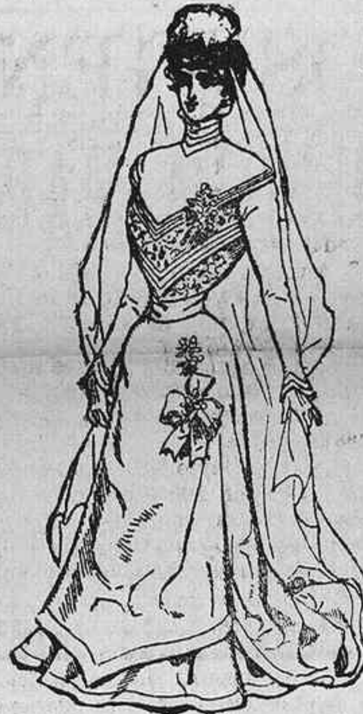
TRAJE DE BODA