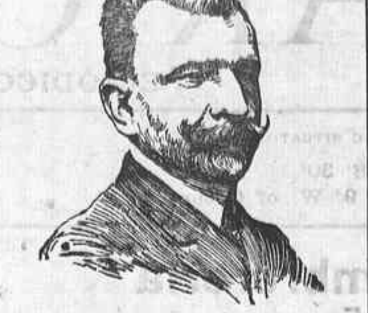
D. Amalio Jimeno nuevo Ministro de Estado.