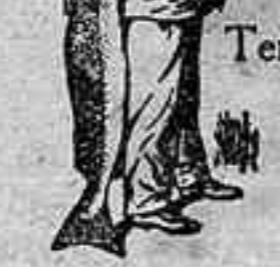
Otárgase siempre la Emulsión con esta marca "El Pescador", marca del procedimiento Scott.

de aceite de hígado de bacalao é hipofosfitos de cal y sosa cuyas intensas propiedades nutritivas se derivan de su alta pureza y actividad de sus ingredientes y de la perfección de su elaboración.