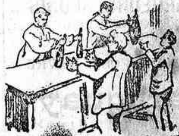
La solución, mañana.

Solución a la Charada en acción que publicamos ayer: