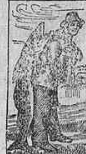
Marca de fábrica.

No es un remedio nuevo que está aún por probarse. Lo conocen favorablemente y lo recetan los principales médicos en casi todos los países del mundo desde hace más de veinte años. Esto se debe á que la Emulsión de Scott es valiosísima en todos los casos de extenuación ó pérdida de carnes. La Tisis, que se consideraba incurable antes de conocerse la Emulsión de Scott, cede ahora rápidamente en sus primeros grados á la potente influencia de este medicamento. Es un maravilloso nutritivo. Con su uso los niños se desarrollan y engruesan cuando la alimentación ordinaria no les nutre en absoluto.