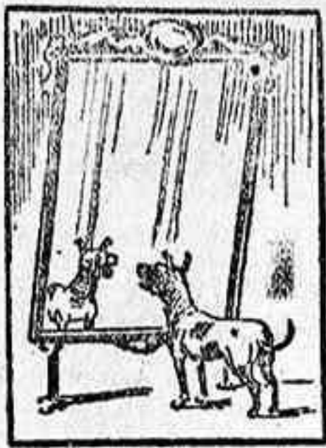
La solución, mañana.