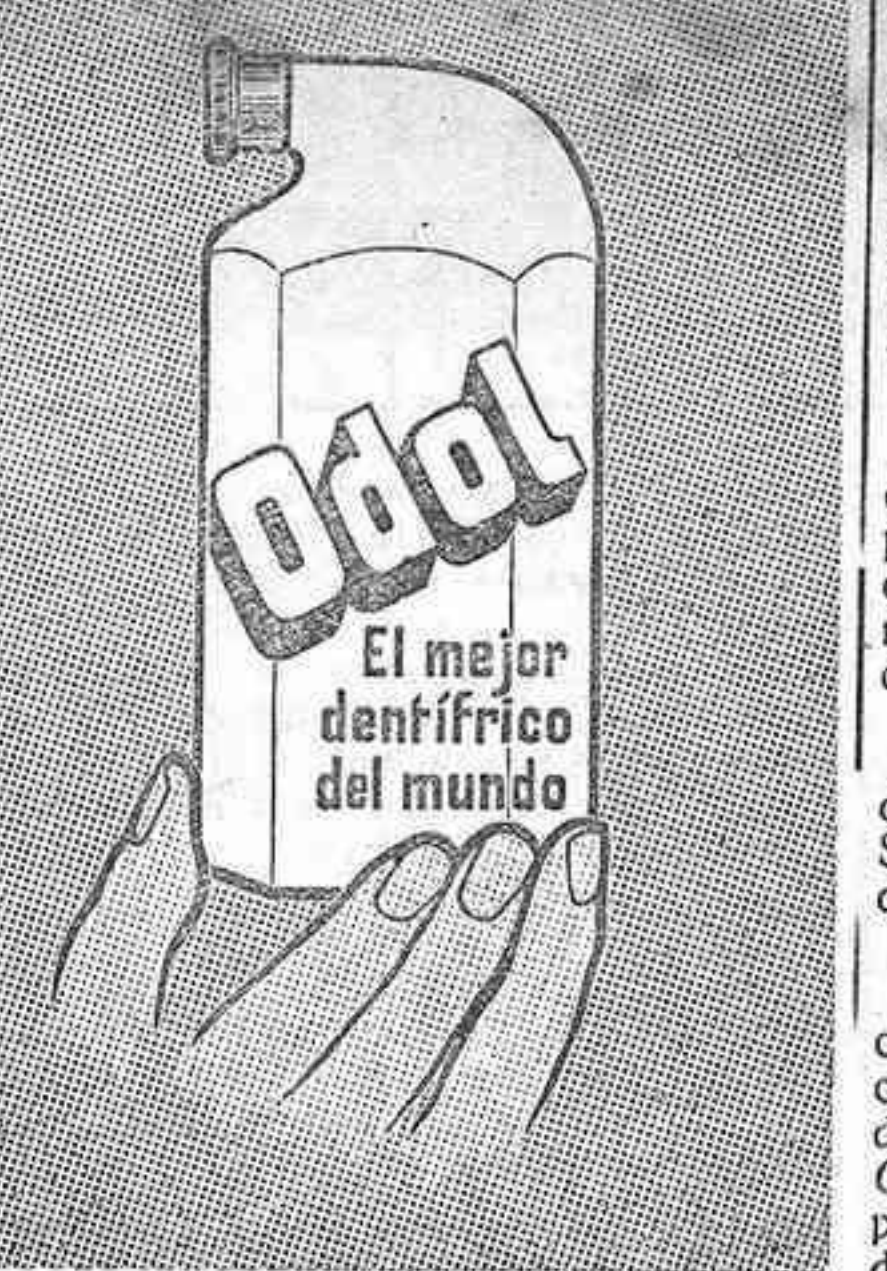
Odol El mejor dentífrico del mundo

Los cambios de estación producen trastornos en la mayor parte de los organismos afecciones que se evitan usando un buen reconstituyente. La Carne Líquida del Dr. Valdés García es el más indicado.