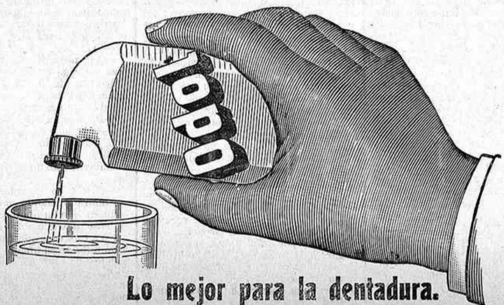
Lo mejor para la dentadura.

Dudoso es que el Gobierno atendiera nuestras peticiones, si las hacemos todas de una vez, disculpándose con la falta de recursos, pero poco a poco, si se razonan bien y se demuestra su necesidad, se pueden ir obteniendo, y fundándose en estas consideraciones, el que suscribe se permite proponer: Primero. Que se solicite del Gobierno la creación en la Granja Agrícola de esta Capital de una ó dos nuevas plazas de obreros maestros en los cultivos y en sus industrias ó de