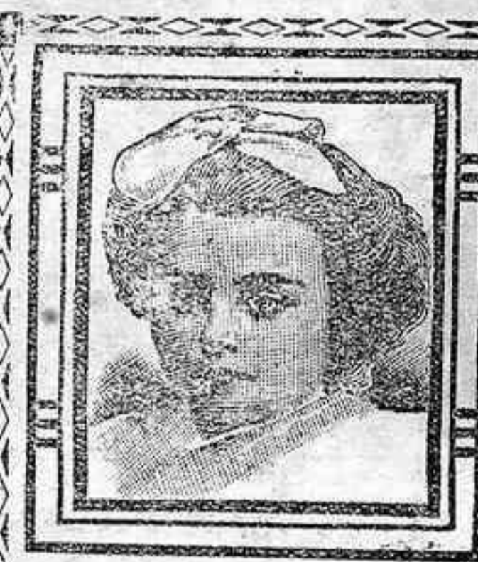
Barcelona, 11 Febrero 1908.

Visite Vd. la Casa de LION TRADING Co. Donde encontrará Vd. lo que desea y a como le convenga.