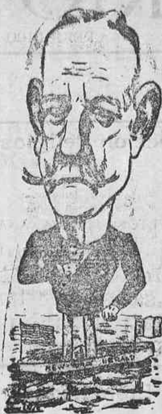
M. James Gordon Bennet