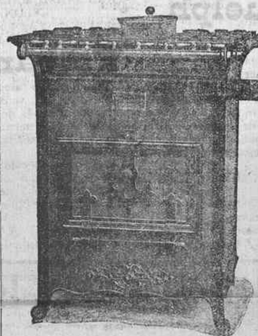
N.º 68ª—Cocina completa con horno y depósito para agua caliente