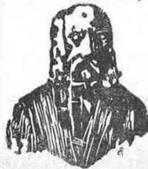
A. Charles Lambert—París. Depósito general Calle Balmes número 106 BARCELONA

El eminente doctor Charles Lambert, de París, después de un profundo estudio sobre las enfermedades venéreas y sífilíticas ha encontrado el medio de curarlas radicalmente, no solo sin hacer uso del MERCURIO, sino que combate las enfermedades contraídas por el uso de dicha sustancia. El tratamiento es sencillísimo y las fórmulas son puramente vegetales, pues en su composición solo entran hierbas minerales de la India. Estas fórmulas las presenta en las formas siguientes: Las Píldoras Charles Lambert, que curan las purgaciones, estrecheces de la uretra, flujo blanco de la muger, y gota militar. La Inyección Charles Lambert, que debe de usarse al mismo tiempo que las píldoras para que la curación sea más radical y pronta. El Elixir Charles Lambert es un gran medicamento, eficazísimo para la completa destrucción de todo bacilo sífilítico. Con su uso se purifica la sangre impura, dejándola en su estado normal, libre de todo virus, dando salud é inmunidad para evitar la reproducción de tan terrible enfermedad.