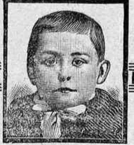
Mataró, 7 Marzo 1908.

CALIDAD SUPERIOR. — PRECIOS ECONÓMICOS Pedidos á J. COLL, calle de San Miguel. Sta. Cruz, Tenerife