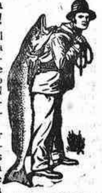
Marca de fábrica.

Quien por una mal entendida economía adquiere un preparado a base de aceite de hígado de bacalao barato, PONE EN PELIGRO LA SALUD DE SU PROPIO HIJO. Insístase en adquirir la auténtica Emulsión SCOTT que es la que lleva la marca de fábrica del hombre con el pescado en la envoltura.