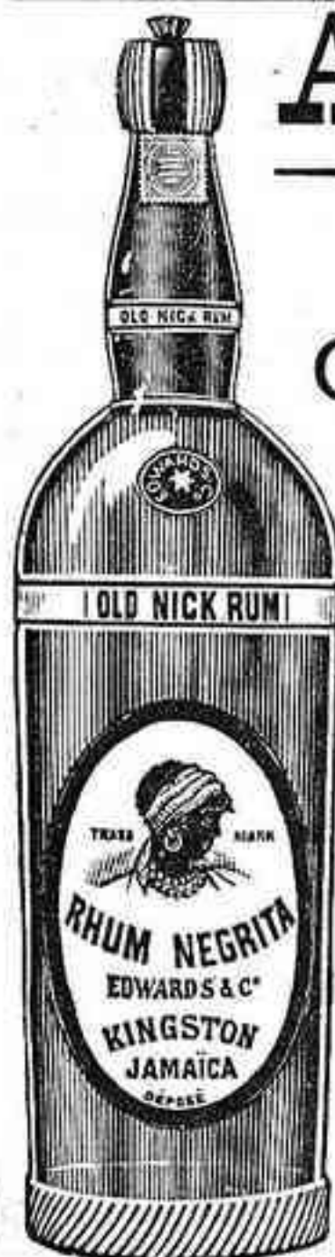
Verdadero "Ron Negrita" Fijarse bien en la etiqueta

de Kingston, (Jamaica), en la etiqueta de la botella, como en la misma verá el lector.