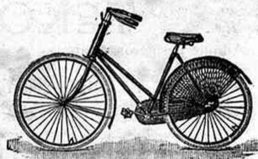
Ladies' D & 17

DEPÓSITO de bicicletas para alquiler y venta.