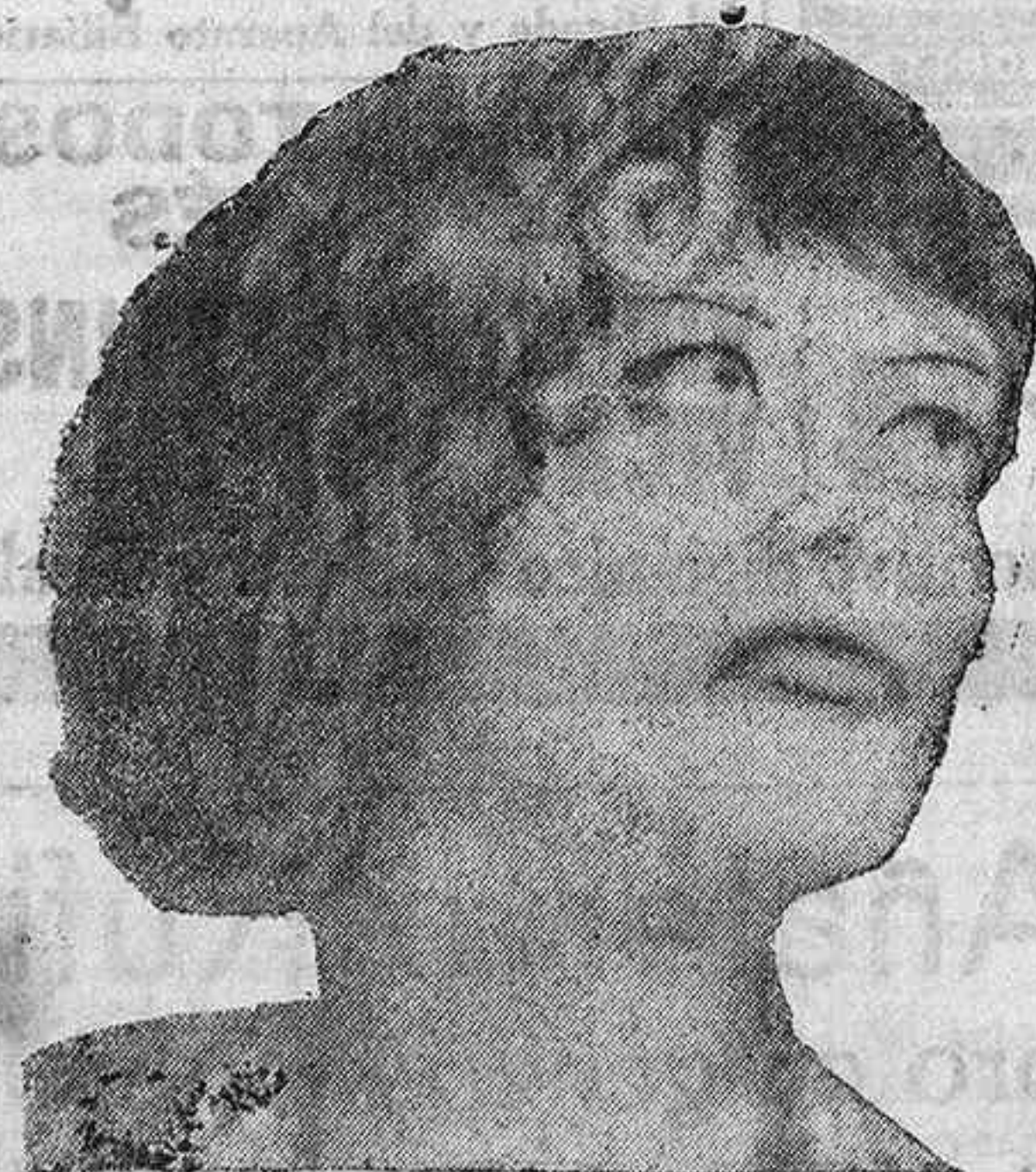
FIGURAS DEL CINEMA

A pesar de su baja en los estudios, Joan Crawford ha querido así tomar un breve descanso para volver con mayores bríos a rescatar el puesto preeminente