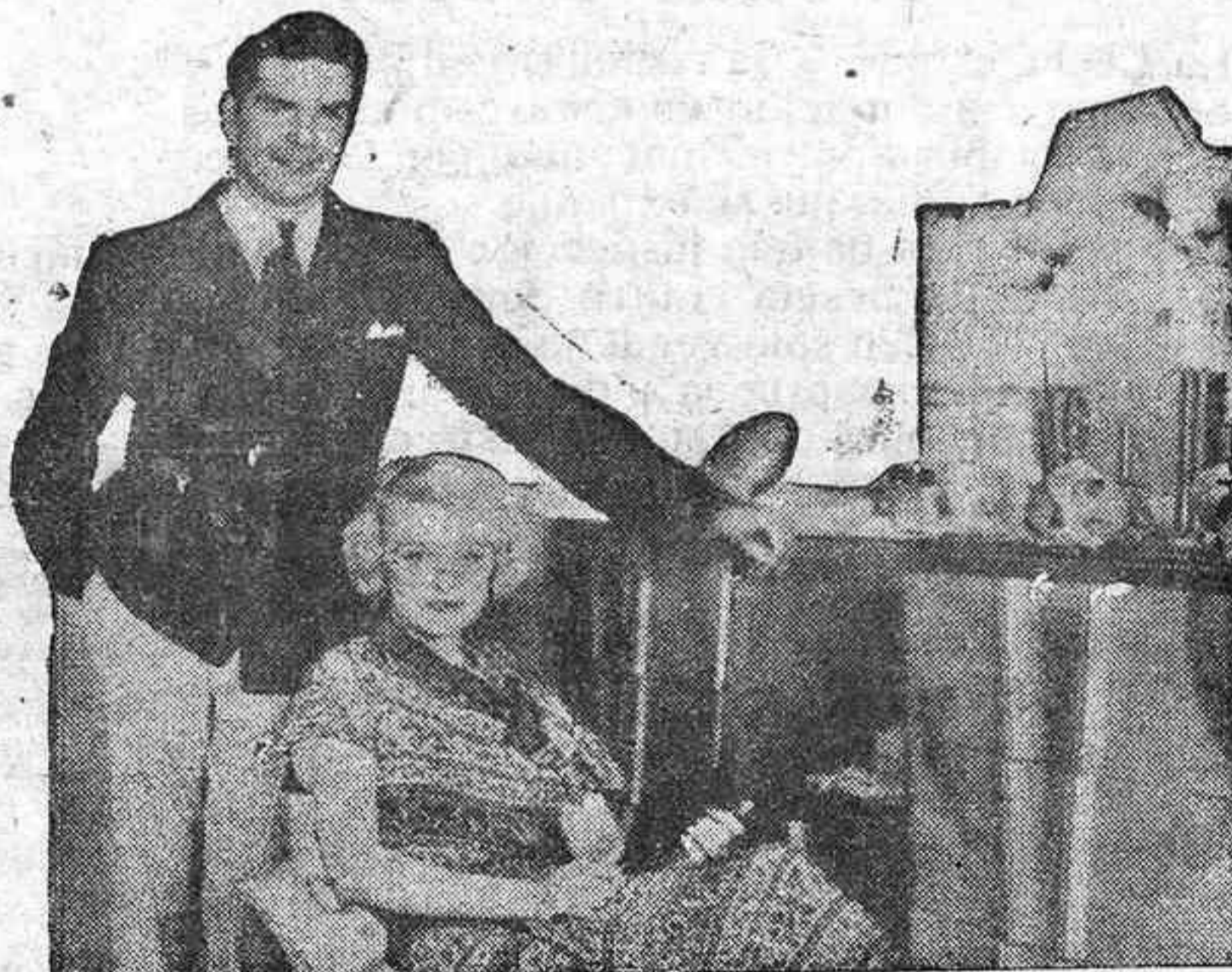
Las grandes "estrellas" también saben ser grandes cocineras cuando llega una ocasión oportuna. Greta Nissen se dispone a ofrecer a Weldon Heybur, una comida muy sabrosa.