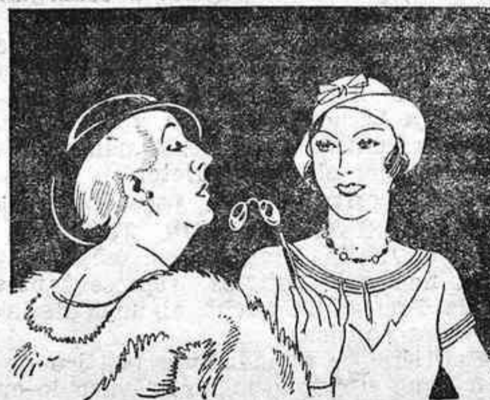
CON BROCHA GORDA