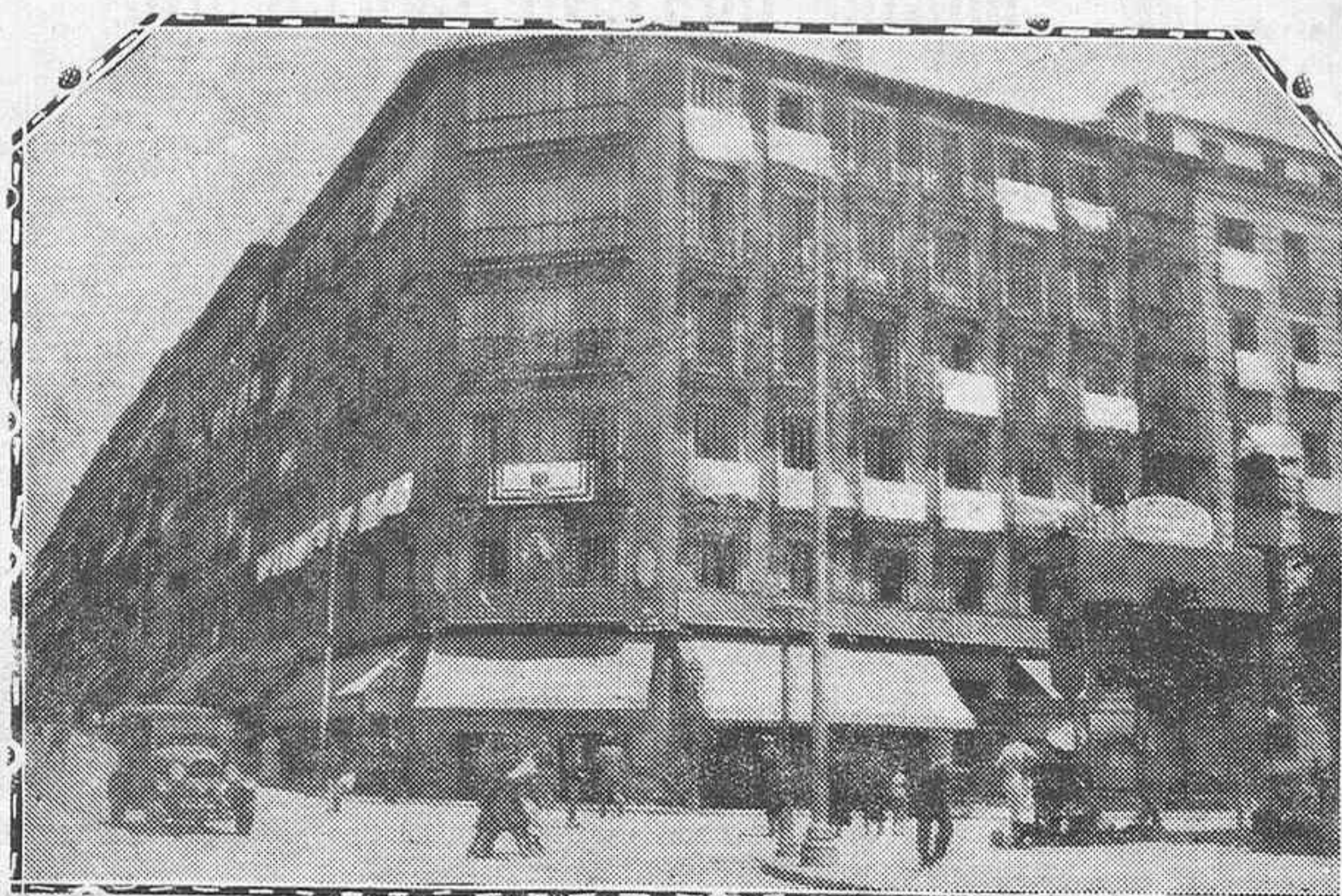
También en los barrios populares de Madrid se vieron en abundancia las colgaduras en la festividad del Sagrado Corazón de Jesús, como lo demuestra este aspecto de la plaza del Progreso.