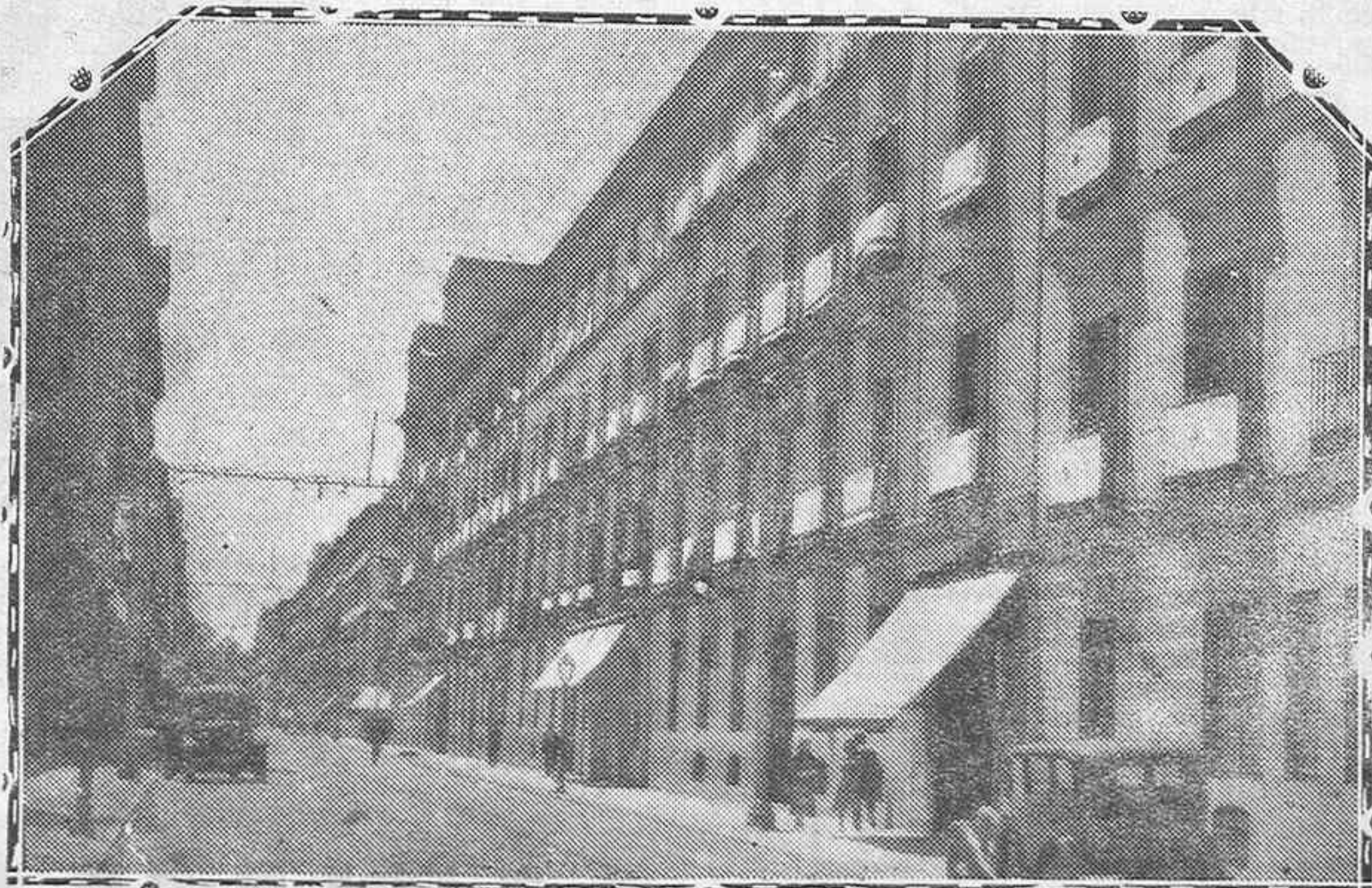
Prueba del fervor católico del pueblo madrileño ha sido la enorme cantidad de colgaduras con que aparecieron engalanados sus edificios el día del Sagrado Corazón de Jesús.—En esta fotografía que publicamos—la calle de Claudio Coello— casi no se ve un hueco sin colgadura.

Las turbas fueron dueñas durante todo el día de la ciudad. Los detenidos eran siempre los que protestaban de los desmanes; no los que los realizaban, ante la pasividad de los encargados de velar por el orden. Y en algunos casos,