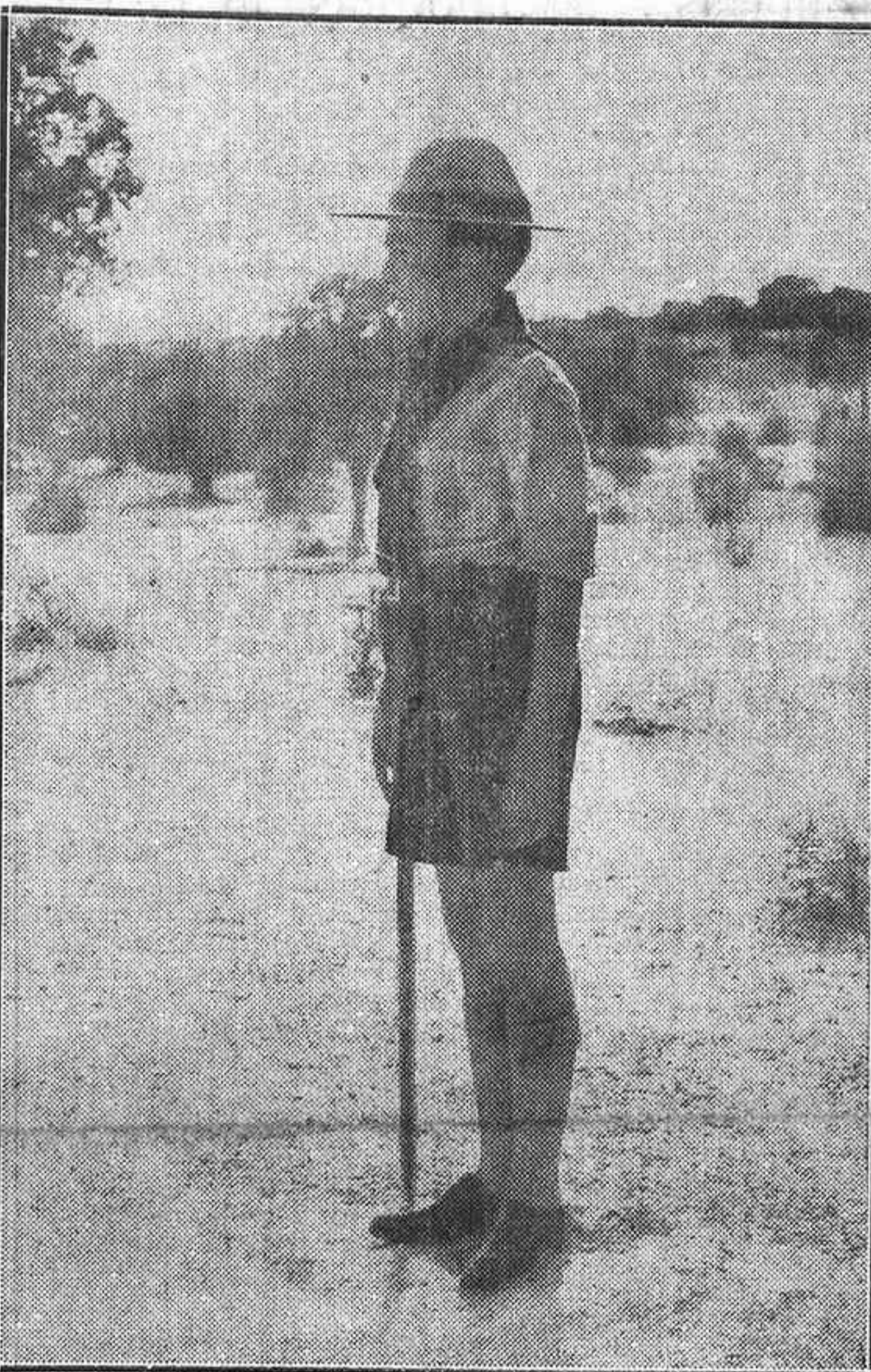
HE AQUÍ UN APUESTO "SCOUT", FIRME SOBRE SUS MUSCULOSOS MIEMBROS DESARROLLADOS ARMONICA Y VIGOROSAMENTE EN CONTACTO INTIMO CON LA NATURALEZA

Por eso vamos a dar aquí una serie de datos acerca de un movimiento que no debemos ignorar, puesto que alcanza y cautiva a una masa considerable de niños, de no pocas naciones. Descuidar el Escultismo equivale a dejar a nuestros encubiertos enemigos una plaza que tan fácil y útilmente