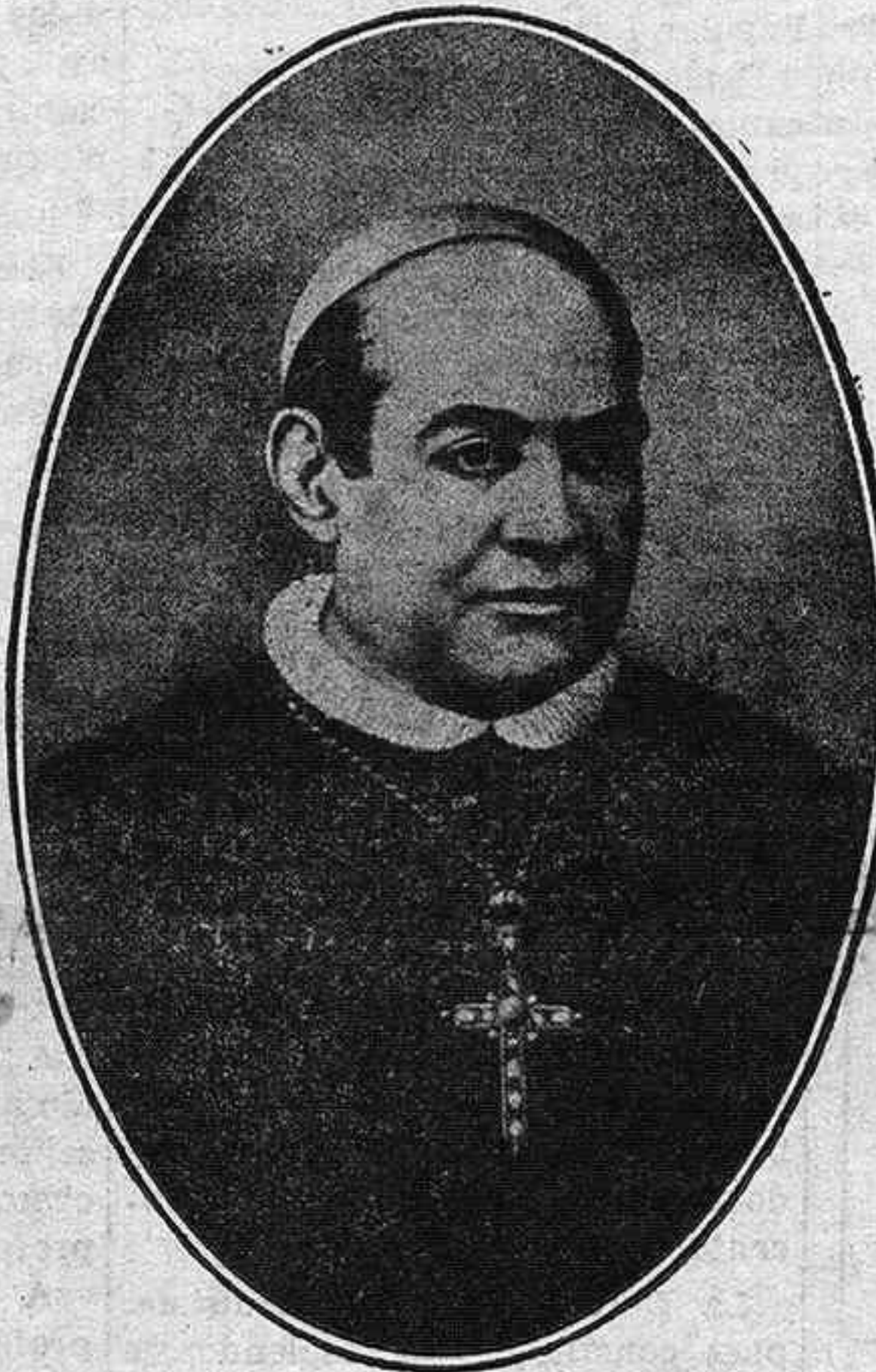
El Beato Padre Antonio María Claret

Atroces injurias, calumnias soeces lanzadas en periódicos, folletines, hojas volantes y hasta en las cajas de cerillas y demás medios de difusión, por los corifeos de la revolución del 68, por las logias masónicas y por políticos ambiciosos, que veían en el insobornable confesor de la Reina un estorbo para la realización de sus planes maquiavélicos y medros personales. Una docena de veces atentaron contra su vida, no pararon hasta lograr desterrarle, y ni aún en el destierro ni en el lecho de su muerte le dejaron tranquilo. Pudo fácilmente defenderse y no quiso; buenos amigos de gran solvencia intelectual y moral quisieron hacerlo, y no se lo permitió; porque esto, decía, le ayudaba a ser humilde. Pe-