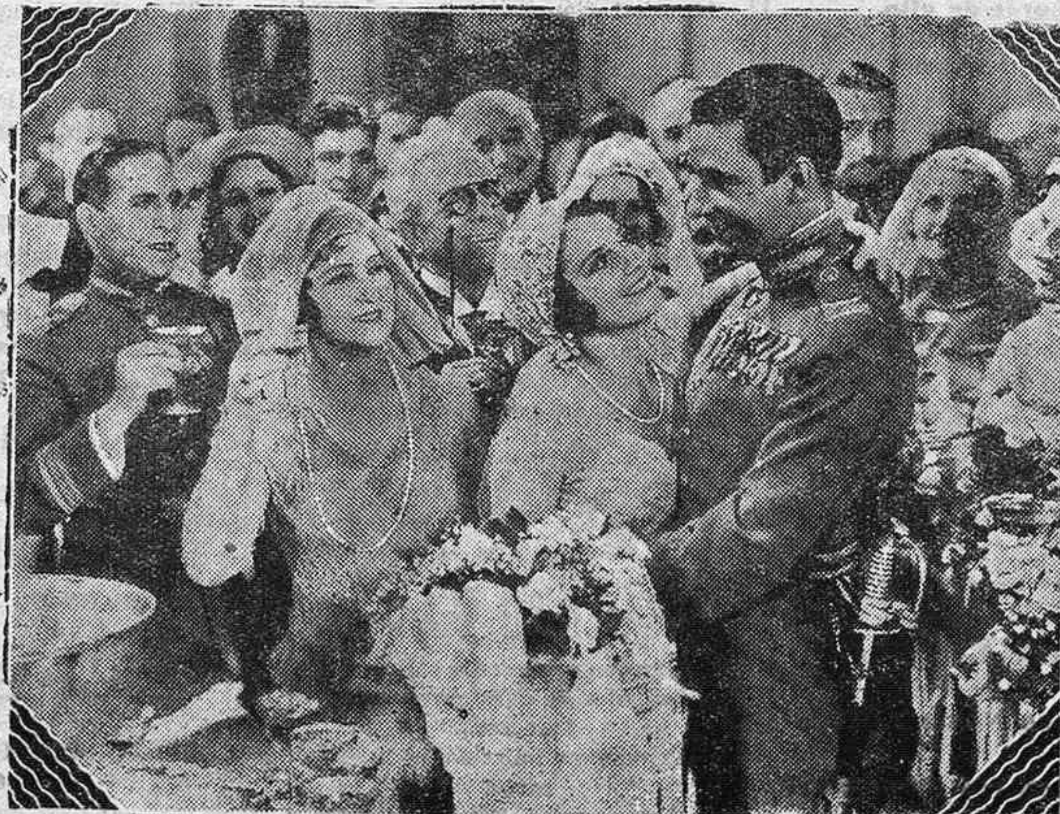
Una de las escenas más interesantes de la película, hablada en español, "La llama eterna", que mundialmente está obteniendo un grandioso éxito.

Durante la filmación de una escena de amor ardió un trozo de bosque, lo que estuvo a punto de ocasionar la pérdida del equipo sonoro.