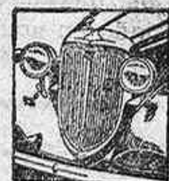
El ACE Un "6" de lujo a precio módico