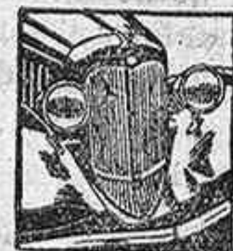
El BEACON Nueva calidad en coches baratos

Cuando lo examine Ud. verá lo magnífico que es el FLYER Continental. Gran espacio para las piernas, gran comodidad, gran elegancia moderna y grandioso funcionamiento. Todo es grande, imenos el precio! Por ejemplo: