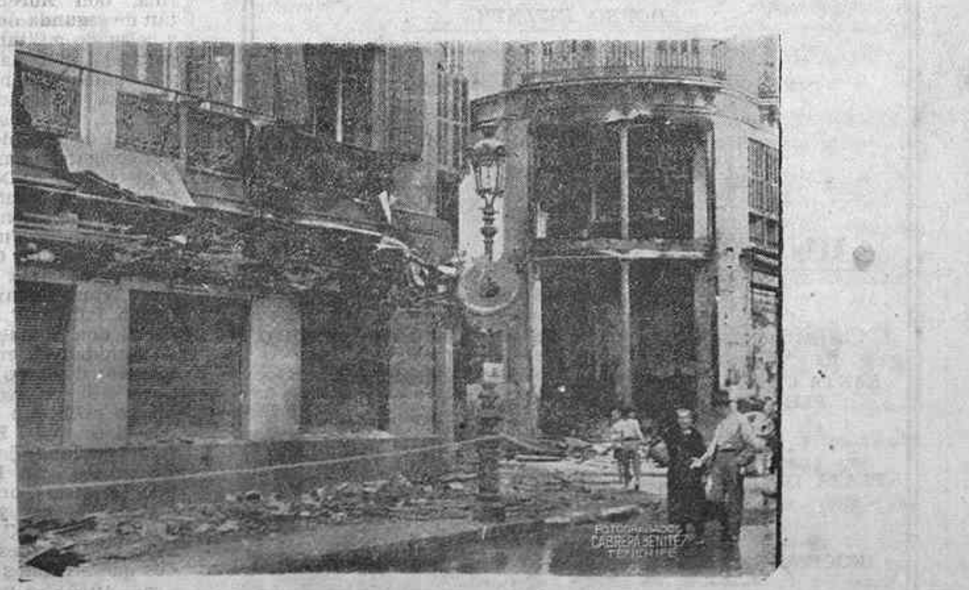
HE AQUÍ EL ASPECTO DE UNO DE LOS TEATROS MALAGUEÑOS INCENDIADOS POR LAS HORDAS MARXISTAS, ENEMIGAS DE TODO ARTE Y DE LA CIVILIZACION