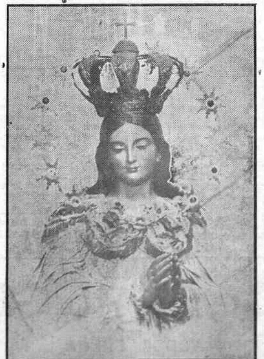
LA INMACULADA CONCEPCION, PATRONA DE ESPAÑA, DEL ARMA DE INFANTERIA Y DEL CUERPO JURIDICO-MILITAR CUYA FESTIVIDAD CELEBRAMOS HOY CON LA IGLESIA Y HA SIDO CONVERTIDA EN FIESTA NACIONAL POR VOLUNTAD EXPRESA DEL JEFE DEL ESTADO. IRIS DE PAZ Y DE CONSUELO. LA PURISIMA NOS BENDICE Y SE PRESENTA A LOS OJOS DE NUESTRA FE COMO AURORA DE LA NUEVA REDENCION DE ESPAÑA. "ESPAÑA POR LA INMACULADA", SEGUIRA SIENDO NUESTRO GRITO DE CONQUISTA Y DE SALVACION.

Con tal motivo realizaránse diversos actos religiosos y profanos en el territorio nacionalista, siendo obsequiadas las tropas con pluses y extras.