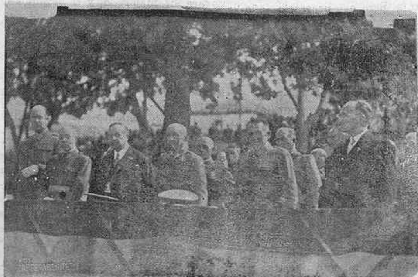
LA PRESIDENCIA DEL DESFILE