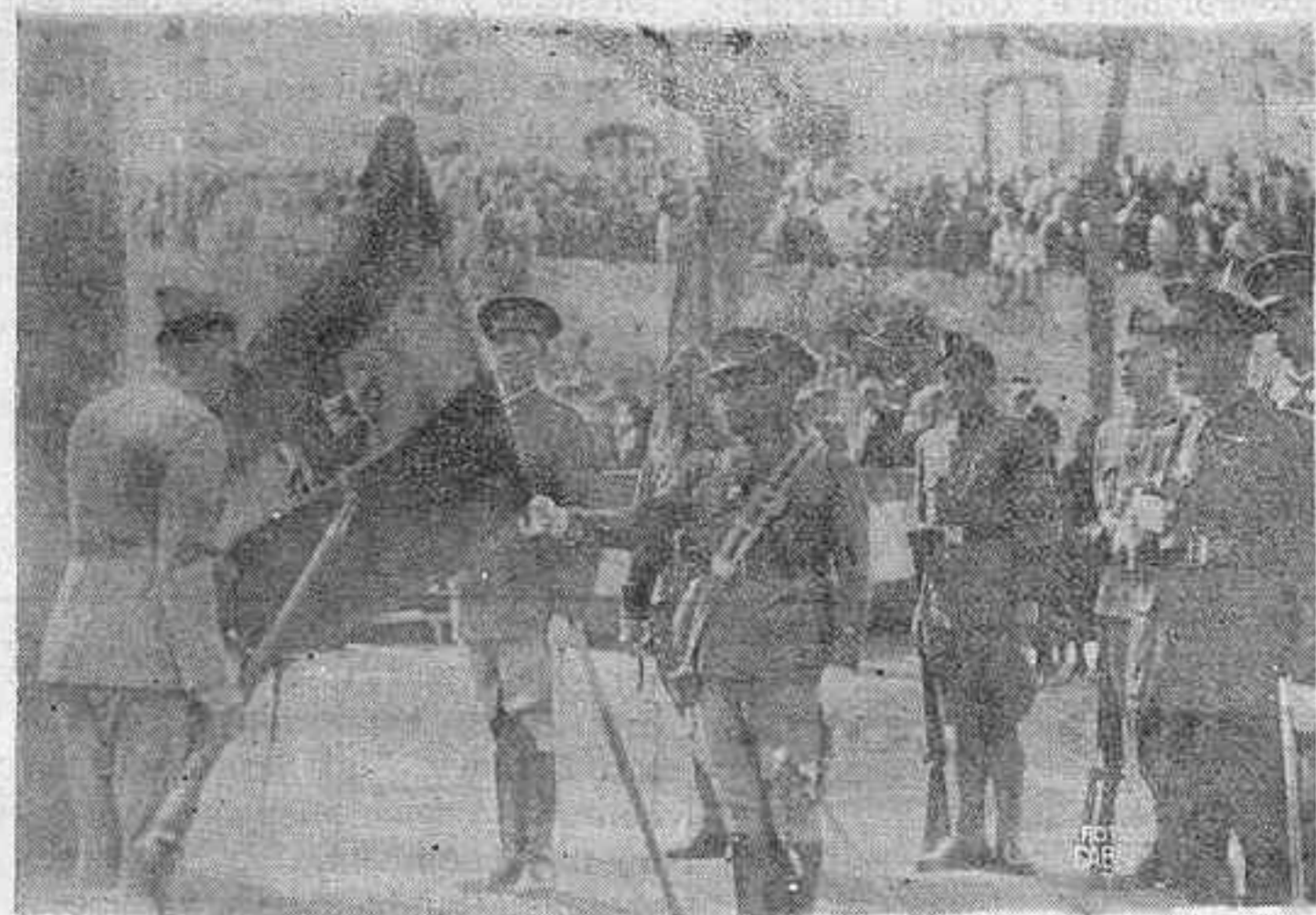
LA JURA DE LA BANDERA