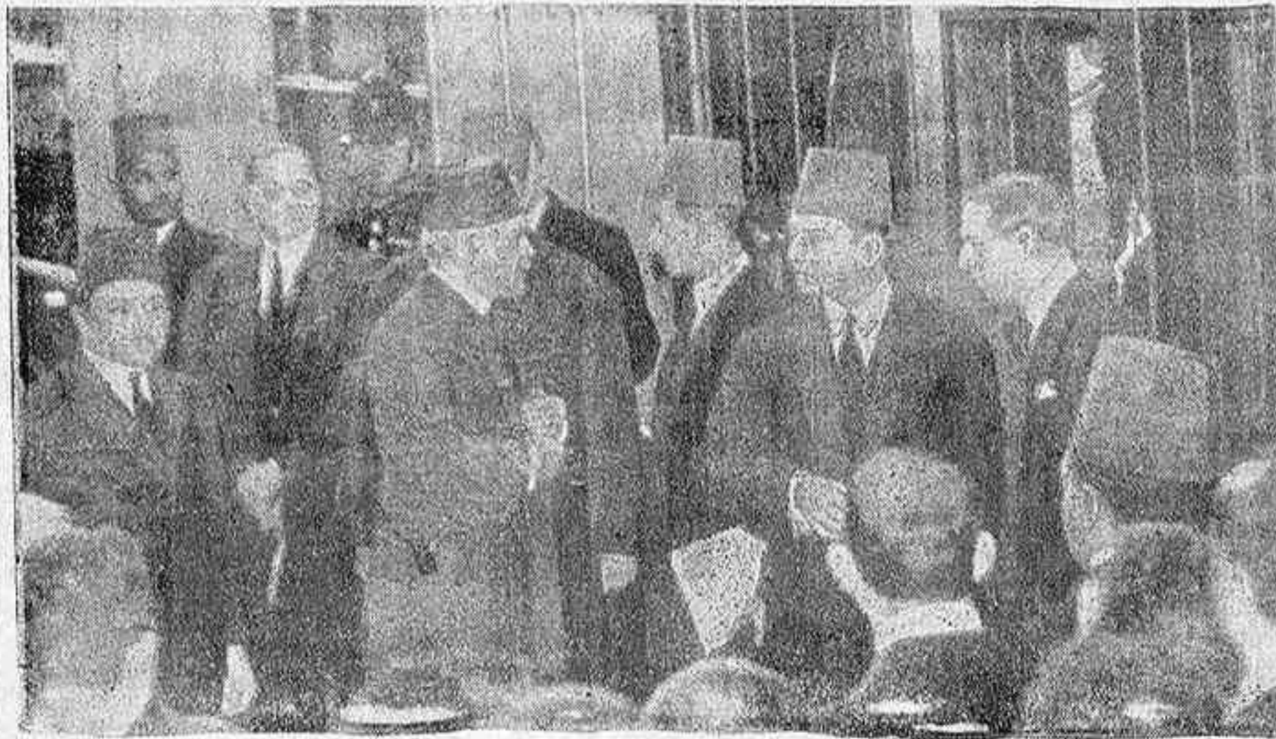
El Rey Farouk, de Egipto, hijo del fallecido Rey Fuad, se despide aquí del duque de Kent, hermano del Rey de Inglaterra, Farouk I aparece en la fotografía acompañado de los miembros de la Legación de Egipto, agradeciendo a los miembros del Gobierno británico las atenciones que este país ha tenido con él.