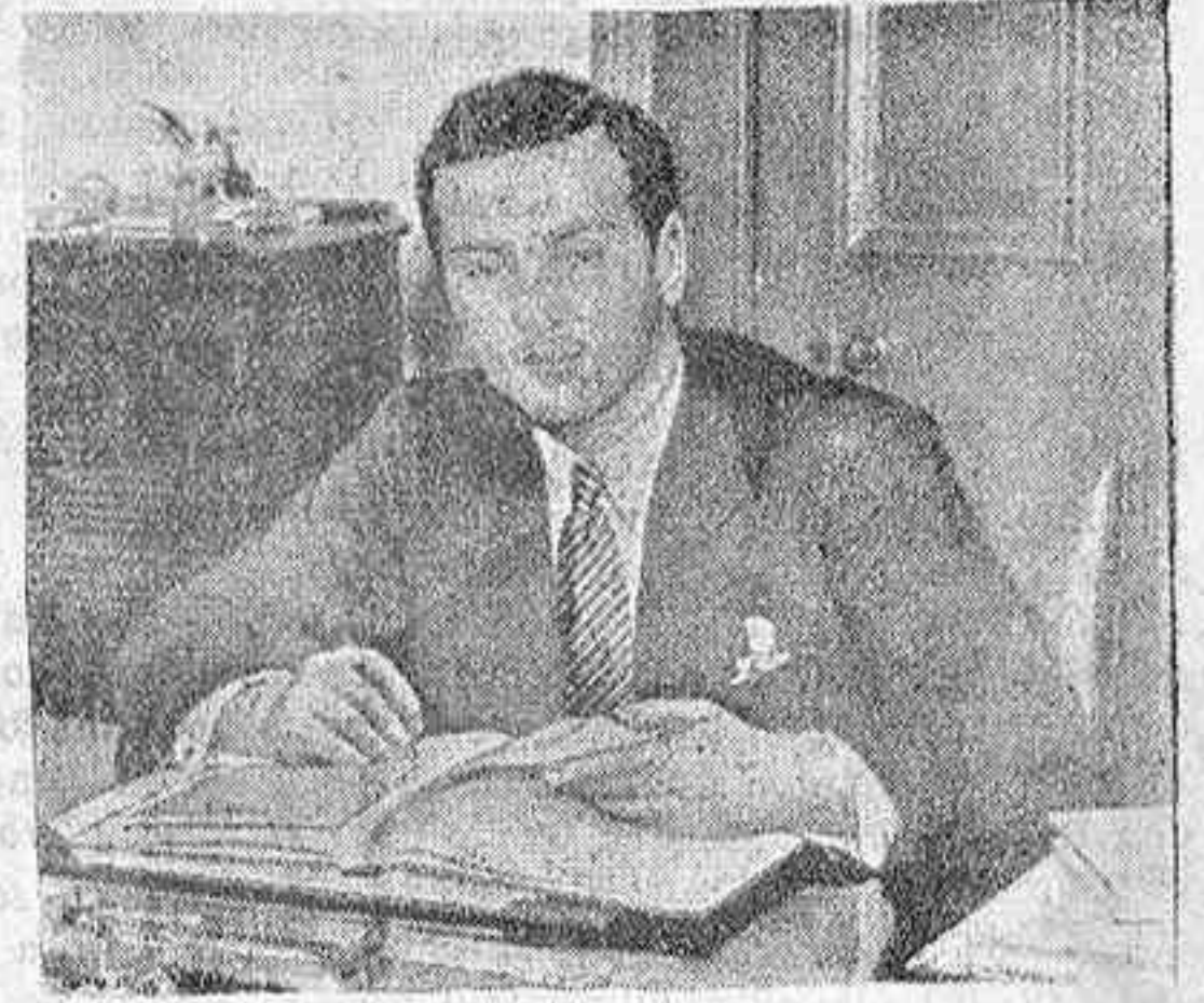
Esta es la última fotografía del nuevo Rey de Egipto, Farouk I, lograda por un fotógrafo de la Agencia Arco Mediterráneo, en la Universidad militar inglesa, donde estaba éste cursando sus estudios.