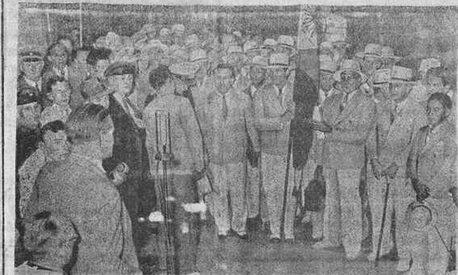
Casi todos los equipos del Extremo Oriente se encuentran ya en Berlín. Aquí ha llegado el equipo de 46 atletas filipinos que tomarán parte en los Juegos Olímpicos