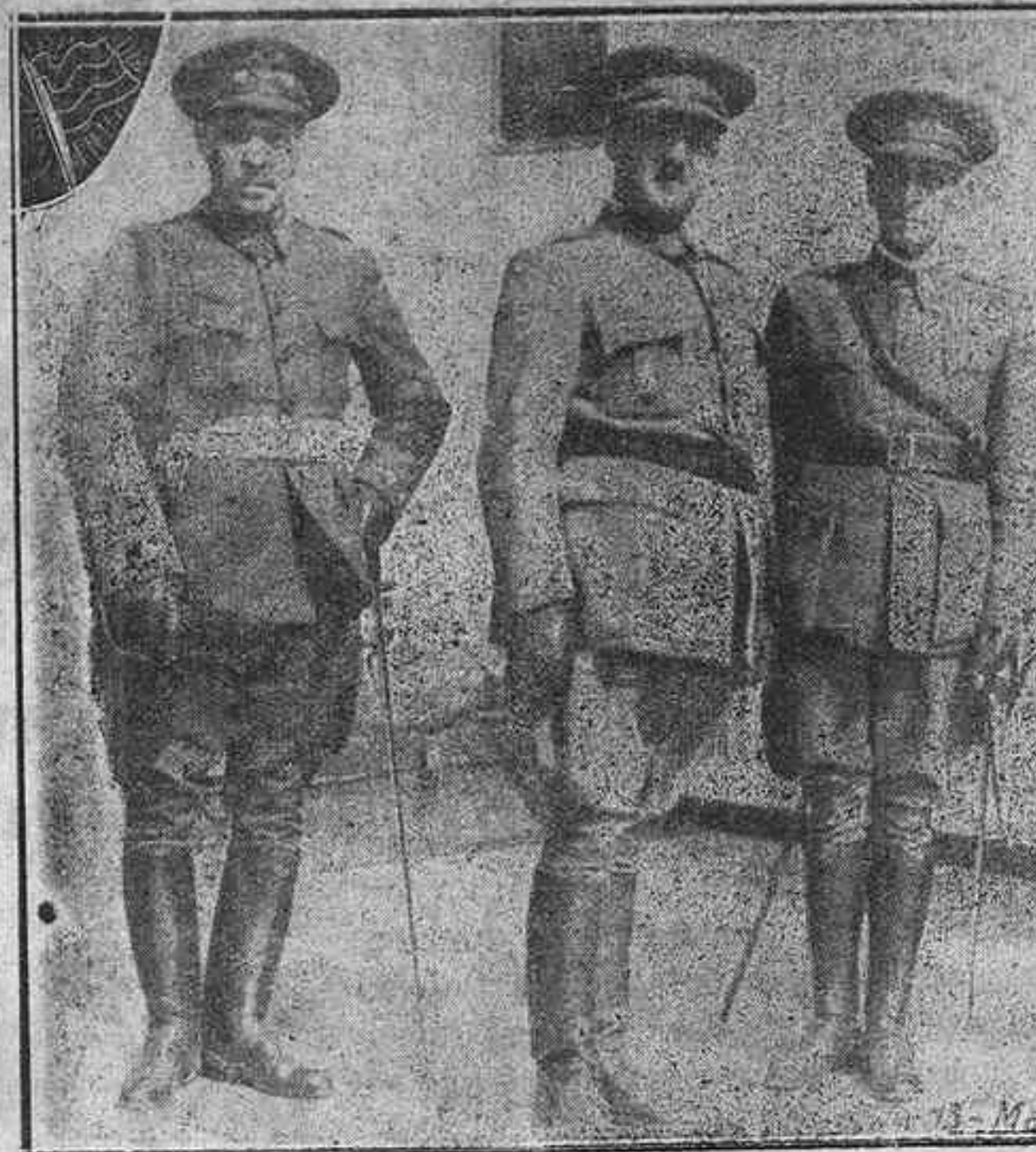
El General Franco, caudillo del movimiento nacional, acompañado de los Coroneles Cáceres y Peral. Alrededor de Franco se agrupan todas las fuerzas de la Nación y todos los ciudadanos españoles que ansían salvar el honor de España

"Me he hecho dueño del Gobierno Civil de Asturias sin resistencia, sumándose a las fuerzas del Ejército la compañía de Asalto que lo custodiaba al grito de ¡Viva España; viva la República!"