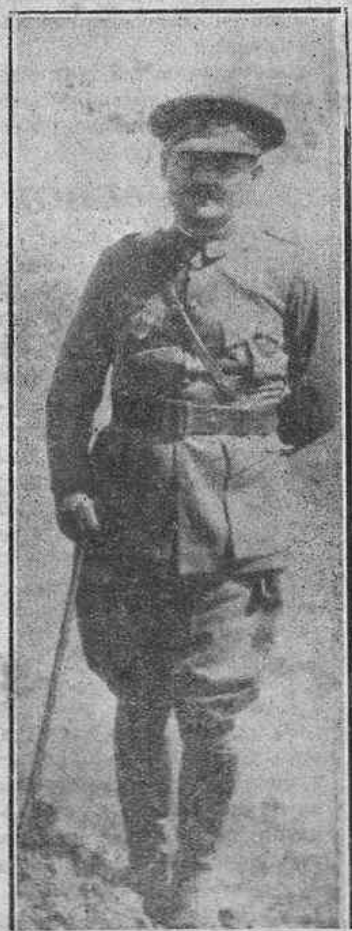
El invicto general Capaz, iniciador del movimiento militar que ha de salvar a la Patria de la barbarie roja y de los que han pretendido vender a España al Extranjero