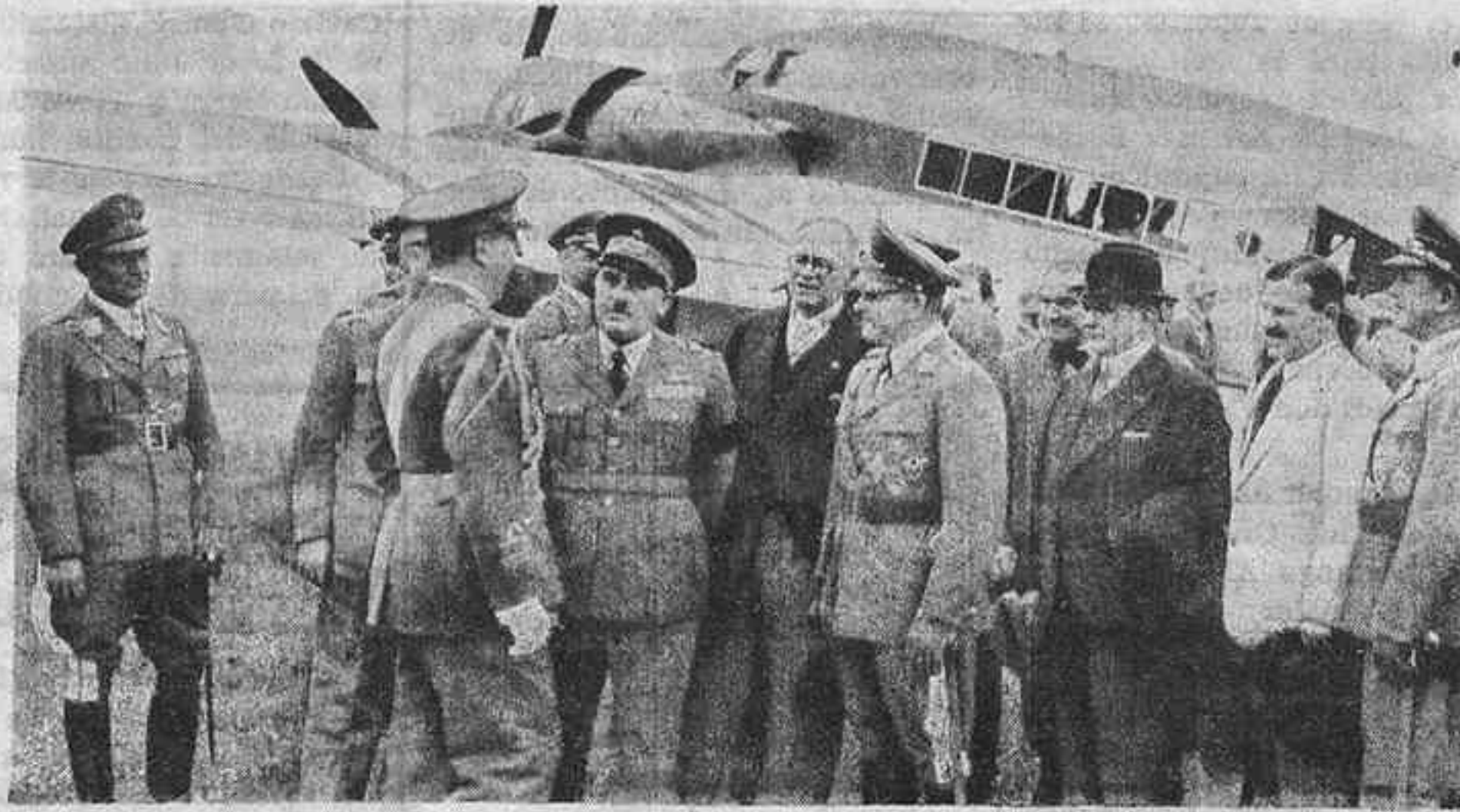
Al aeropuerto militar de Staaken-Berlin ha llegado el general Valle, acompañado de M. Antolico, embajador de Italia en Berlín, y fué cumplimentado por el general Milch. La visita del general Valle es oficial.