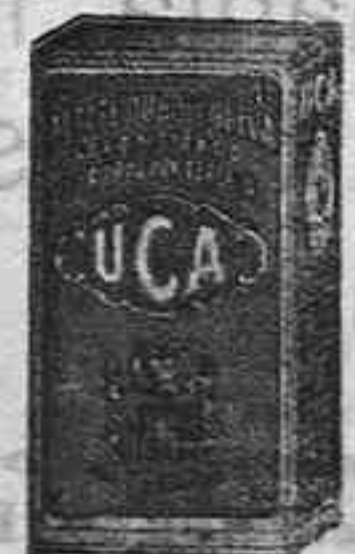
Salgado y Cia