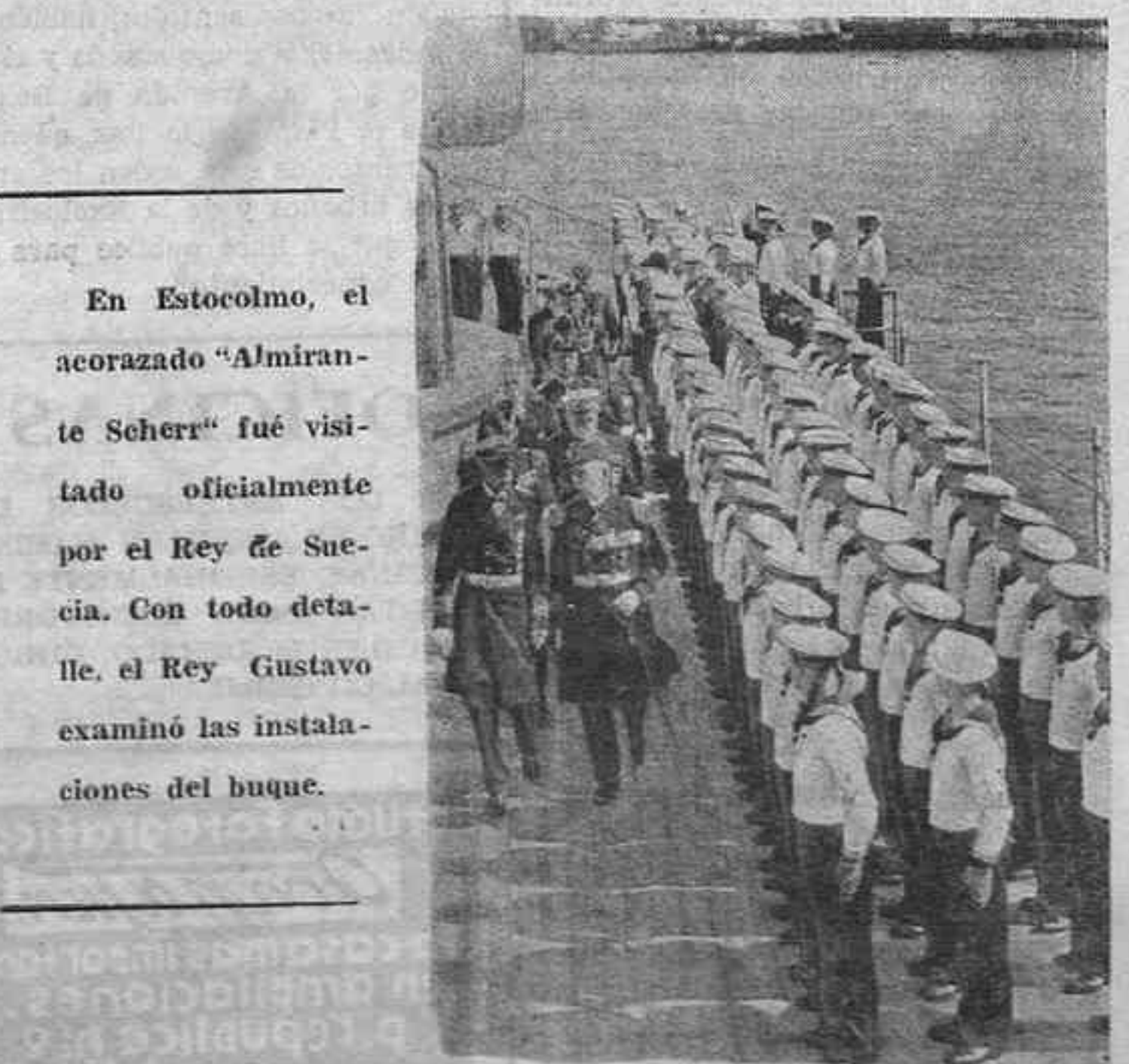
En Estocolmo, el acorazado "Almirante Scheer" fué visitado oficialmente por el Rey de Suecia. Con todo detalle, el Rey Gustavo examinó las instalaciones del buque.