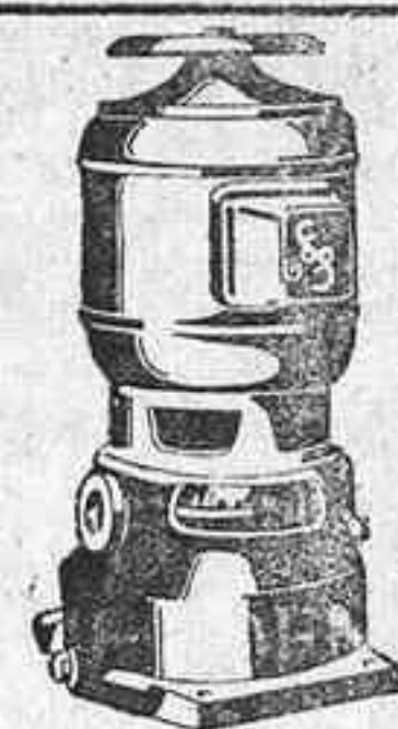
Con motor monofásico. Ideal para casas particulares hasta 900 litros por hora y 17 metros de altura manométrica.

SIEMENS INDUSTRIA ELECTRICA S.A. Oficina Técnica: Tenerife, San José, 13.