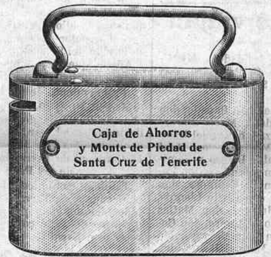
Caja de Ahorros y Monte de Piedad de Santa Cruz de Tenerife

Para informes: MARINA, 12.—Teléfonos: 278, 80 y 821