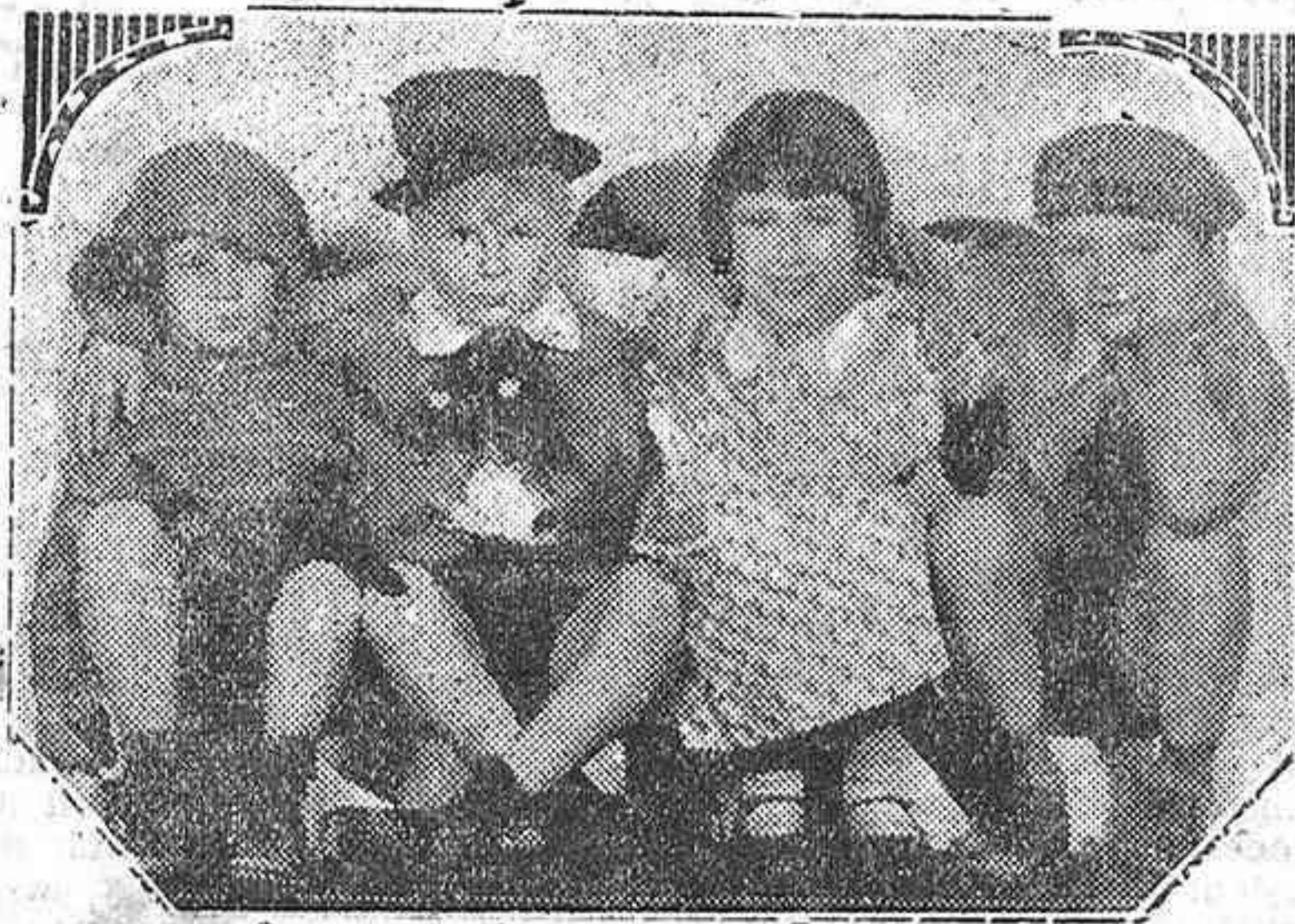
Los principales intérpretes de la admirable película "Las peripecias de Skinny", de extraordinario éxito.

Wallece Beery nunca hace uso de ingrediente alguno, si le es posible evitarlo. Si tiene que maquillarse, lleva sus afeites en un sobre de manila. El maquillaje de Jackie Cooper lo lleva su madre en la bolsa de mano.