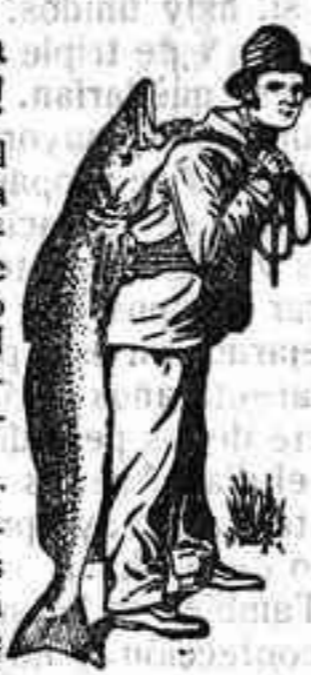
Marca de fábrica.

Quien por una mal entendida economía adquiere un preparado a base de aceite de hígado de bacalao barato, PONE EN PELIGRO LA SALUD DE SU PROPIO HIJO. Insistase en adquirir la auténtica Emulsión SCOTT que es la que lleva la marca de fábrica del hombre con el pescado en la envoltura.