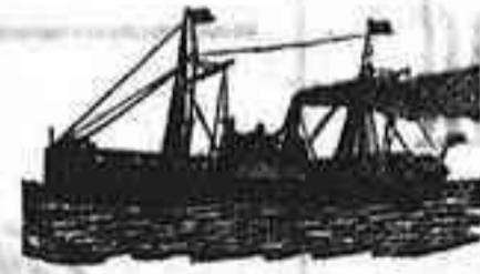
El moderno vapor francés

llegará el de y saldrá el mismo día directamente para la HABANA