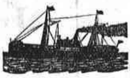
El magnífico vapor

(*) Estos vapores harán escala en Santa Cruz de Tenerife, siempre que haya carga ó pasaje suficiente.