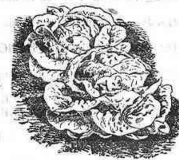
LECHUGA de todo tiempo