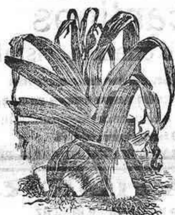
PERRO (Ajo porro)