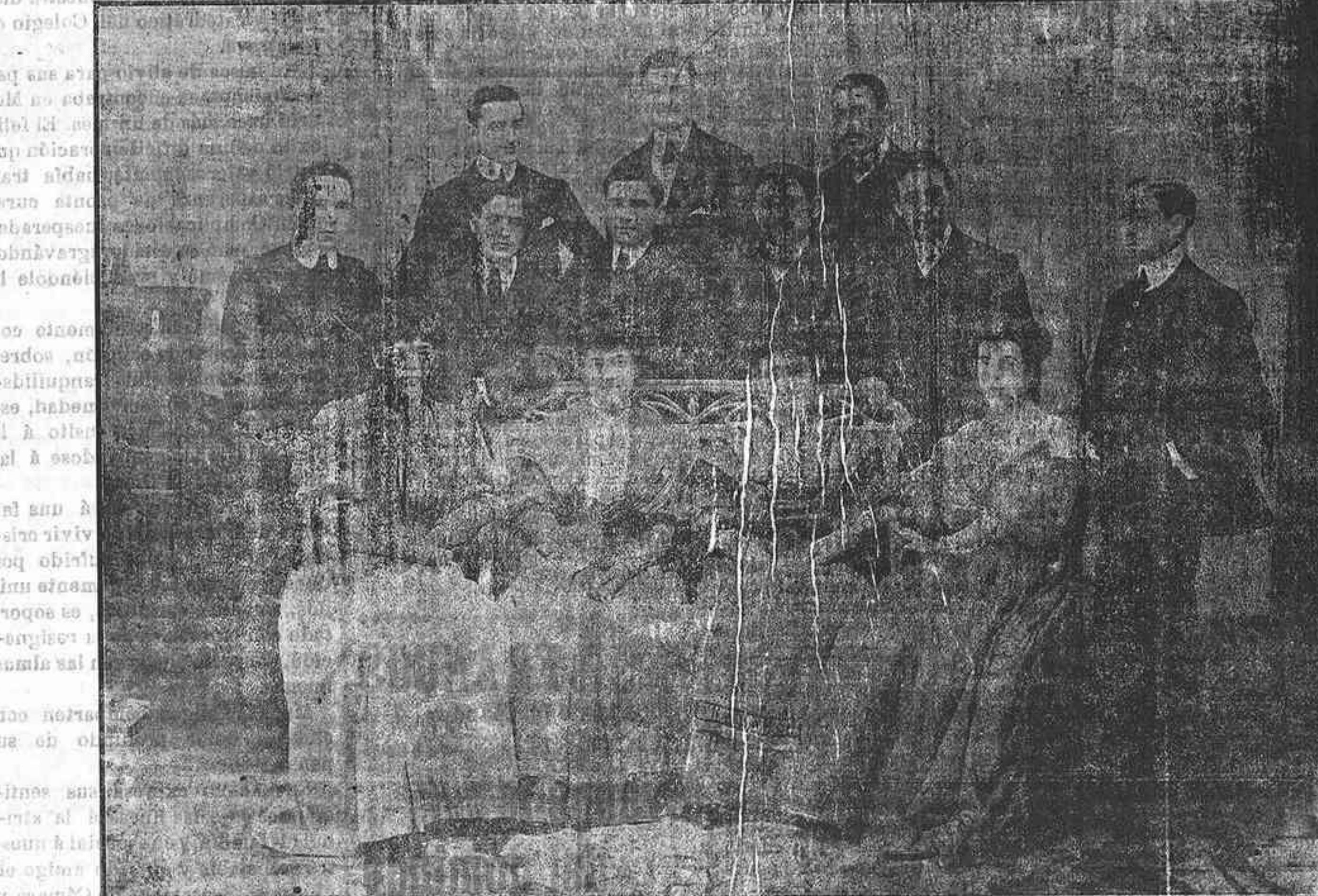
Cuadro artístico de «EL TEATRO»

Día 24. —Trigo añojo, a 48 reales los 56 5/8 litros (fanega). Centeno, a 36. Cebada, a 32 id. id. Algarrobas, a 33.