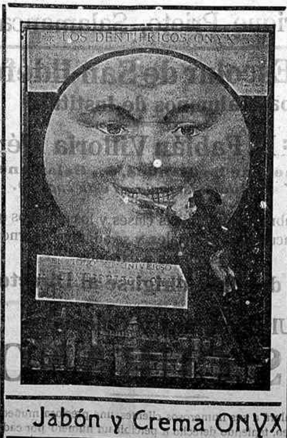
Jabón y Crema ONYX

¿Hay algo más desagradable y nocivo que una boca descuidada?