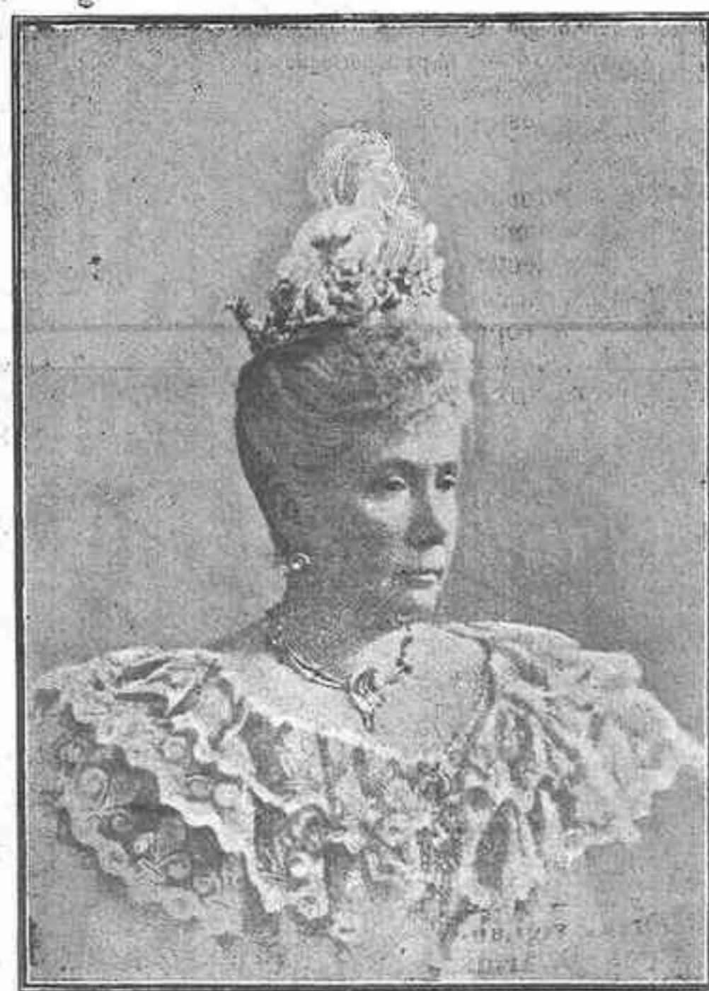
S. A. R. la Infanta Doña Isabel

E enquanto ao longe a diluida estancia se esvae a perde quasi, o coro das cascatas a distancia repete a mesma phrase.