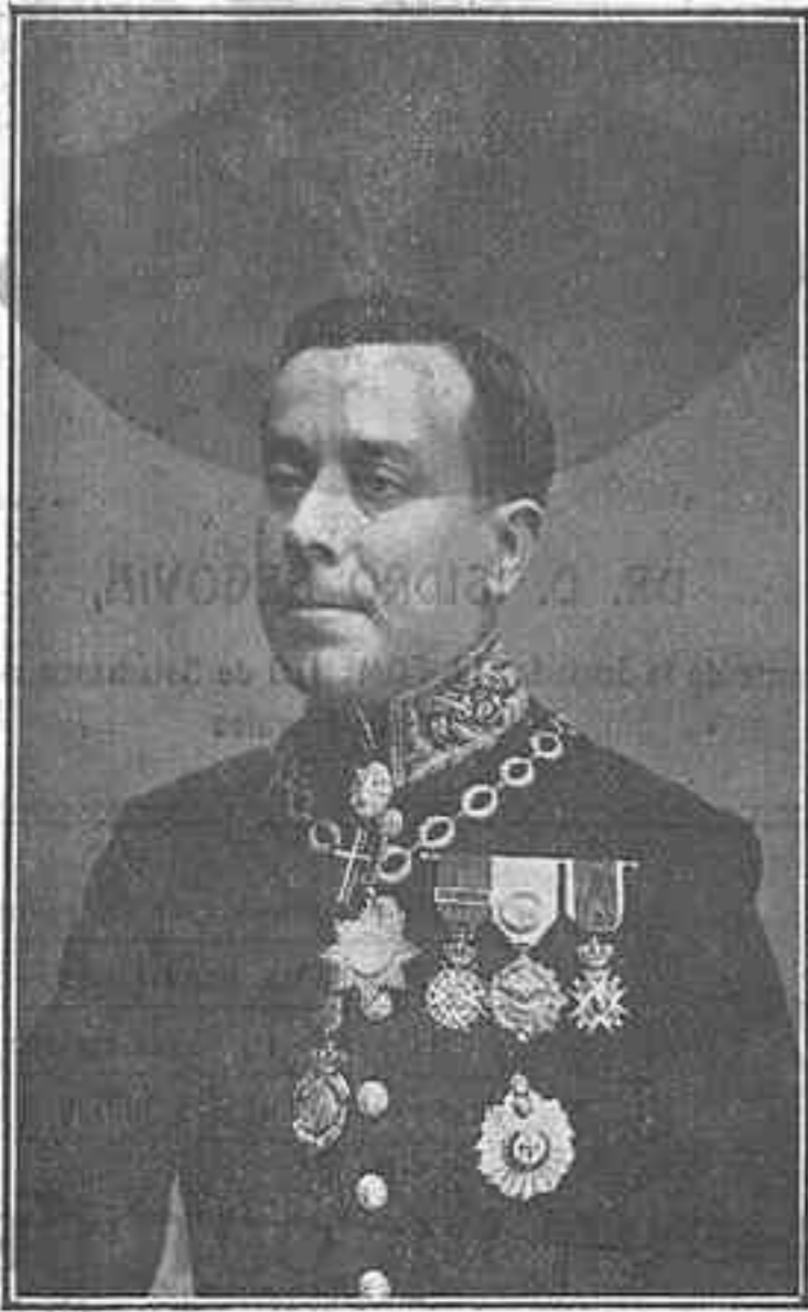
EXCMO. SR. D. EUGENIO DE CASTRO Presidente del Jurado portugués

POESÍA PRESENTADA AL TEMA I.ª — POESÍA LÍRICA, A LA QUE EL JURADO HA ADJUDICADO COMO PREMIO ESPECIAL LA COPA, REGA- LO DE S. M. LA REINA AMELIA DE PORTUGAL