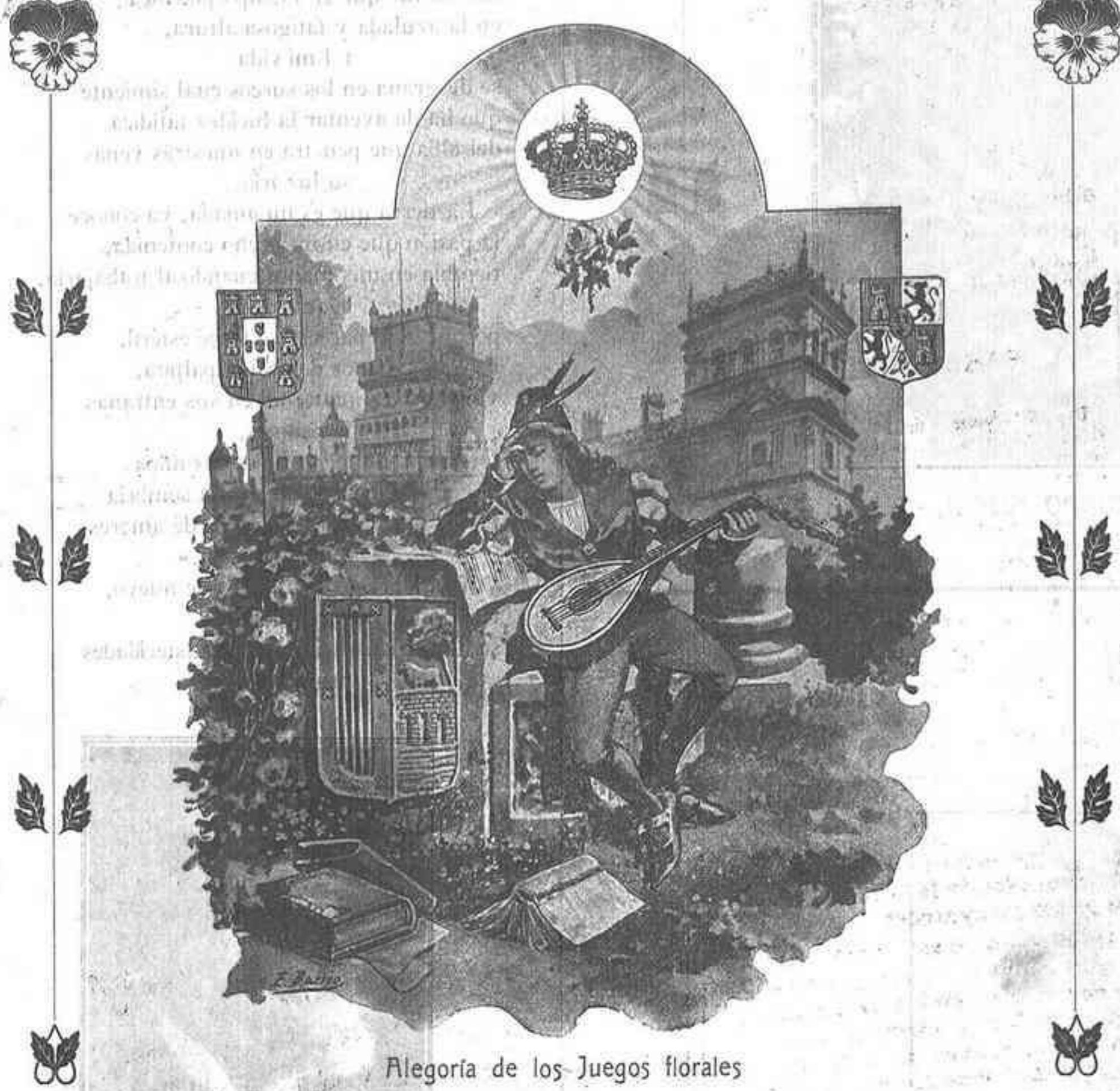
Allegoría de los Juegos florales