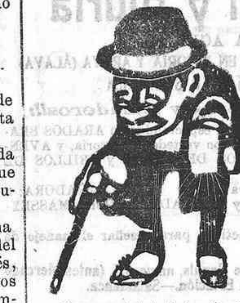
Busca usted trabajos tipográficos, confeccionados esmeradísimo y con economía?

Tipografía Popular. Imprenta de "El Salmantino".