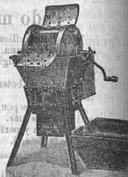
Máquina de lavar. Todo tipo.

Útil á todos: desde la familia más reducida hasta los más grandes establecimientos.