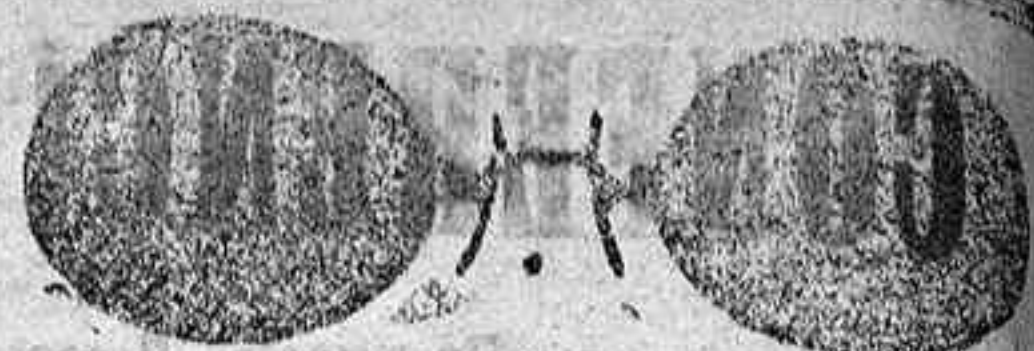
Este modelo, en níquel, 5 pesetas.

Gran surtido en relojes finos y corrientes, en ORO, DE SEÑORA Y CABALLERO; relojes de plata, acero y níquel, marcas escogidas; despertadores de bolsillo con cisternas. Radio: RELOJ ORO DE LEY, en correa, para caballero y señora, 40 pesetas; en níquel, 7. Inmenso surtido en toda clase de gafas o lentes, en oro, oro chapeado, níquel y concha; GAFA O LENTE oro chapeado, clase garantizada, con cristales graduados, a 12 pesetas en níquel, 5. ESTUCHE PIEL AMERICANO, 1,25 en relación de precios con los restantes. Se despachan recetas de los señores oculistas. Primera casa para instalaciones de Relojes de torre, dando grandes facilidades para los pagos.