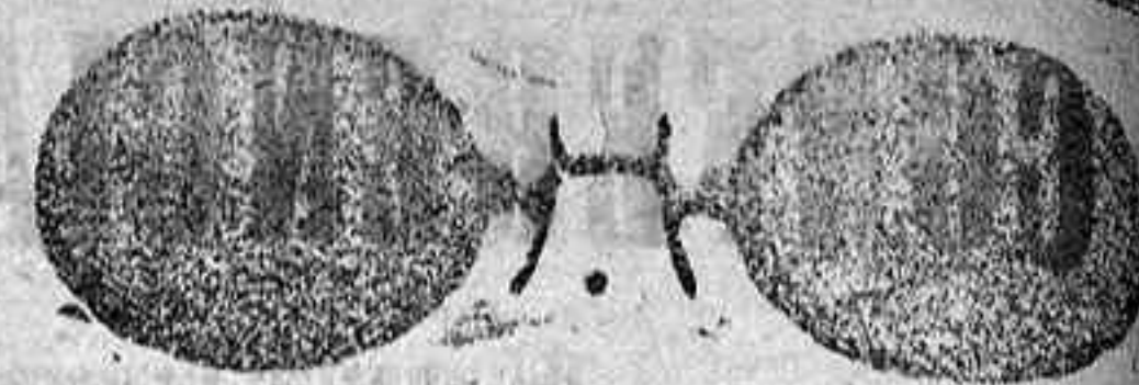
Este modelo, en níquel, 5 pesetas.

Plaza Mayor, 40 (acera de Correos), Salamanca. Gran surtido en relojes finos y corrientes, en ORO, DE SEÑORA Y CABALLERO; relojes de plata, acero y níquel, marcas escogidas; despertadores de bolsillo con esferas Radio. RELOJ, ORO DE LEY, en correa, para caballero y señora, 40 pesetas; en níquel, 7. Inmenso surtido en toda clase de gafas o lentes, en oro, oro chapeado, níquel y concha; GAFAS O LENTES, oro chapeado, clase garantizada, con cristales graduados, a 12 pesetas en níquel, 5. ESTUCHE PIEL, AMERICANO, 1,25 en relación de precios con los restantes. Se despachan recortes de los señores oculistas. Primera casa para instalaciones de Relojes de torre, dando grandes facilidades para los pagos.