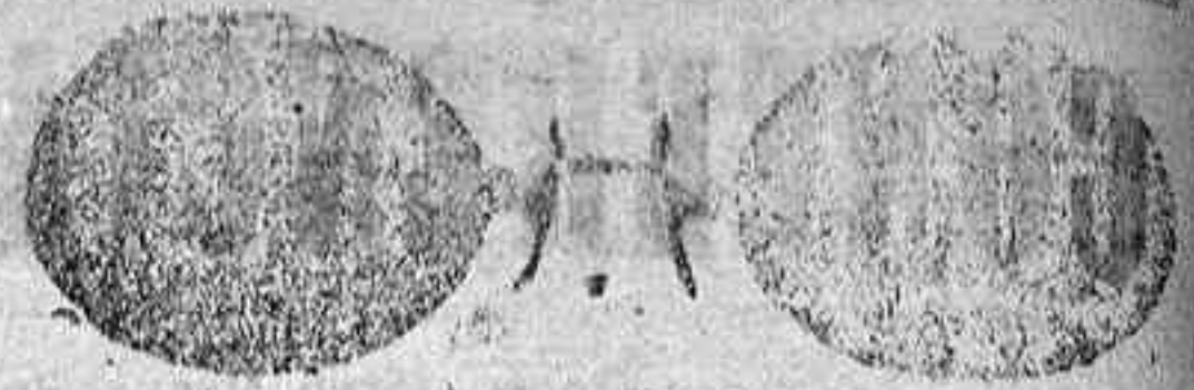
Este modelo, en níquel, 5 pesetas.

Gran surtido en relojes finos y corrientes, en ORO, DE SEÑORA Y CABALLERO; relojes de plata, acero y níquel, marcas escogidas; despertadores de bolsillo con esferas Radio. RELOJ, ORO DE LEY, en correa, para caballero, señora, 80 pesetas; en níquel, 7. Intenso surtido en toda clase de Gafas o Lentes, en oro, chapeado, níquel y concha; GAFAS O LENTES, oro chapeado, clase garantizada, con cristales graduados, a 12 pesetas; en níquel, 5. ESTUCHE PIEL, AMERICANO, 1,25 en relación de precios con los restantes. Se despachan recetas de los señores oculistas. Primera casa para instalaciones de Relojes de torre, dando grandes facilidades por los pagos.