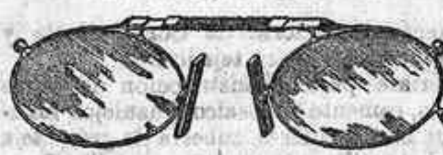
Lentes o Gafas de CRISTAL ROCA, 5 Pesetas.