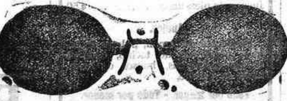
Este modelo, en níquel, 5 pesetas.

A pesar de la gran subida de la mayoría de los artículos, sigo vendiendo a los mismos precios. Gran surtido en relojes finos y corrientes, en ORO, DE SENORAY CABALLERO; relojes de plata, acero y níquel, marcas escogidas; despertadores de bolsillo con esferas Radio. RELOJ, ORO DE LEY, en correa, para caballero o señora, 40 pesetas; en níquel, 7.