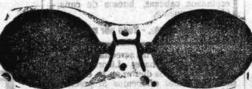
Este modelo, en níquel, 5 pesetas.

Gran surtido en relojes finos y corrientes, en ORO, DE SEÑORAY CABALLERO; relojes de plata, acero y níquel, marcas escogidas; despertadores de bolsillo con esferas Radio. RELOJ, ORO DE LEY, en correa, para caballero o señora, 40 pesetas; en níquel, 7.