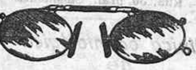
Lentes o Gatas de CRISTAL ROCA, 5 Pesetas.